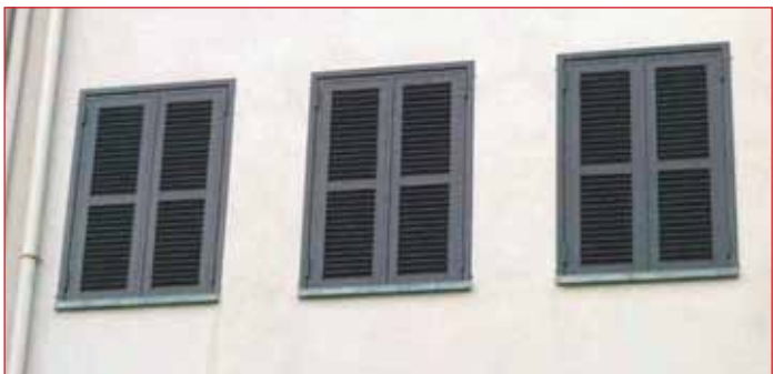
Canvi de persianes de la biblioteca i el teatre municipal

L'Ajuntament ha fet feina durant el darrer any en la millora d'instal·lacions i edificis municipals. Entre les obres realitzades es troba la que s'ha duit a terme al cementeri, on s'ha millorat la zona d'aparcament i s'ha creat una rampa d'accés. Això permetrà facilitar l'accés als vehicles i l'estacionament.