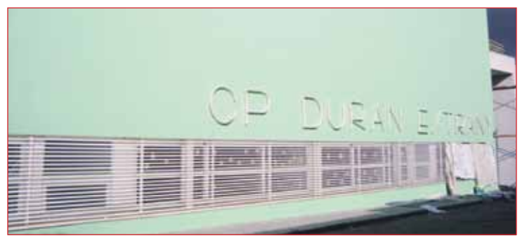
Igualment, s'ha pintat la façana del Duran Estrany, amb un cost de 9.000 €