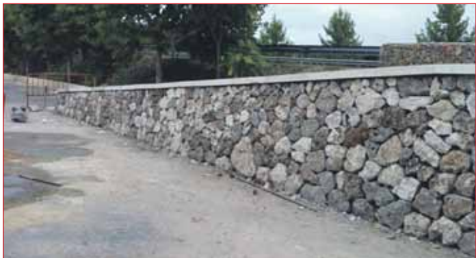
Rampa d'accés al cementeri