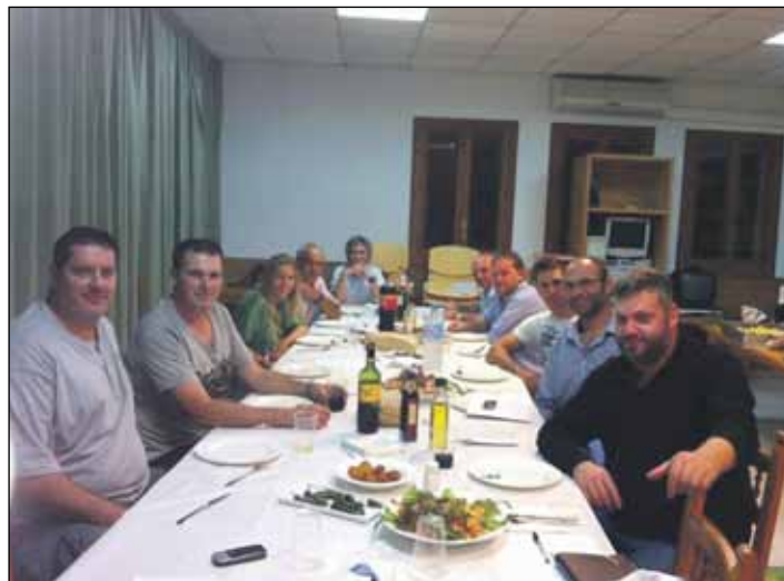
Imatge del sopar al qual Vallespir convidà els responsables de les associacions esportives

Aquesta encontre entre dins les trobades que habitualment es celebren entre el responsable d'Esports de l'Ajuntament i de les associacions esportives per tal d'abordar tot allò relacionat amb l'esport del nostre municipi