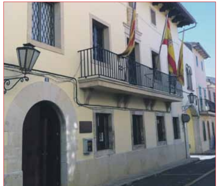
La façana de l'Ajuntament també ha estat pintada

Mentre, l'Ajuntament du a terme també una campanya de manteniment i millora d'edificis municipals, com és el cas de la Casa de la Vila, a la qual s'han pintat tant la façana com l'interior, com s'ha fet a la façana del Duran Estrany, amb un cost de 9.000 euros.